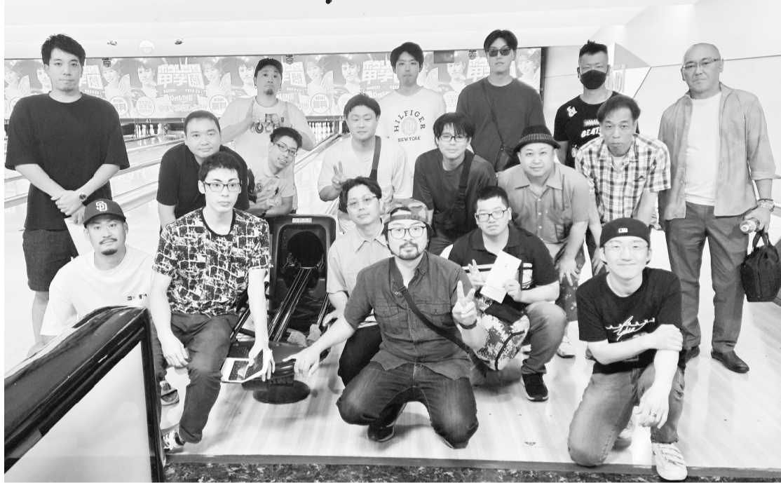
参加者で集合写真