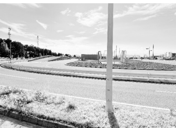
2016年に設置された自動車教習所