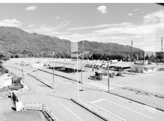
奥には教習所とバンク