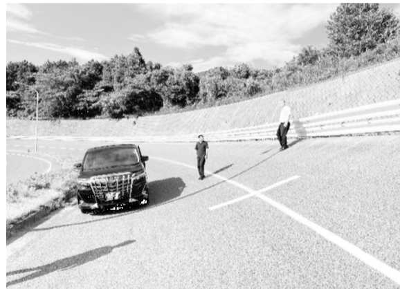
27°のバンク 想像以上の急角度!