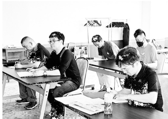
学習に取り組む三四労部会員

「与え給われるもの」を意味し、古くは殿様から家臣に与えられるものでした。そうした意味合いがあることから我われ労働組合では給料も給与もひっくり返して「賃金」と呼ぶのが一般的です。