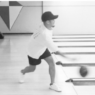
西部長による始球式

9月28日、青年部主催によるボウリング大会を大阪市内で開催しました。このレクリエーション活動は、青年部のリスタートから長らく企画されながらも、コロナ禍などの事情により開催が見送られていました。今回ようやく開催に至り、阪神支部にとつてもしばらくぶりのイベントとなりました。当日は青年部メンバーや担当執行部を含め合計18名が参加し、日頃の業務から一時離れリフレッシュと交流を目的としたこのイベントは予想を超える盛り上がりを見せました。大会は、ランダムに選ばれた3人1組のチームで3